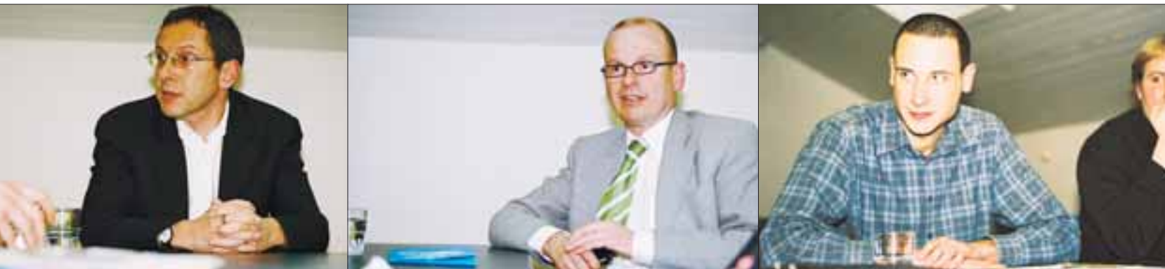
ann, Nationalrat, Präsident des Aargauischen chaftsbunds und GL-Mitglied der SP Aargau.