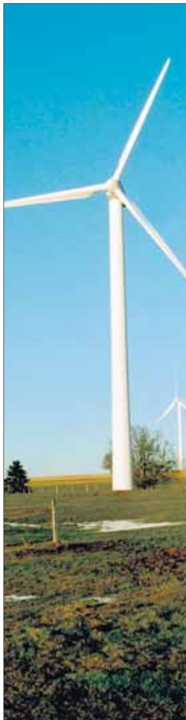
Windpark auf dem Mont-Crosin.

Ständerat muss die Referendumsmöglichkeit wieder einbauen und an den positiven Vorgaben des Nationalrats für die Erneuerbaren festhalten. Denn für die SP ist klar, dass den Anliegen der Ökologie dieselbe Priorität zukommt wie den gewerkschaftlichen. Nur so werden Nachhaltigkeit sowie Versorgungssicherheit und der Schutz der Arbeitsplätze möglich.