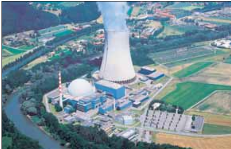
Der Grossteil der radioaktiven Abfälle fällt in den fünf Schweizer Kernkraftwerken Mühleberg, Beznau I und II, Gösgen-Däniken und Leibstadt an. Wohin damit?

Mit dieser Argumentation wird systematisch unterschlagen, dass mit der Erzeugung von Atomstrom grosse Risiken für die Bevölkerung einher gehen, dass Atomenergie in keiner Weise nachhaltig ist, weil Uran nicht endlos zur Verfügung steht und bereits beim Abbau die Gesundheit der Arbeiter massiv beeinträchtigt. Es wird unterschlagen, dass die Si-