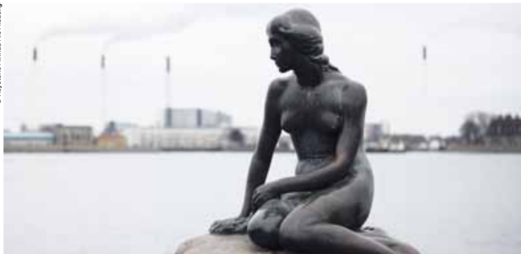
Der Klimagipfel in Kopenhagen: Eine peinliche Vorstellung für die gesamte Menschheit.