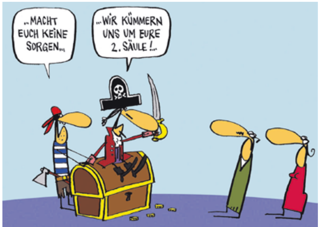
Die Versicherungsgesellschaften wollen ja bloss das Beste – fragt sich einfach, für wen.

Die 1,6 Millionen Versicherten bezahlen den Lebensversicherungen 770 Franken Verwaltungskosten pro Jahr. Sogar die Kosten des Abstimmungskampfs werden von den Versicherten bezahlt, denn die Finma lässt es zu, dass unvorhergesehene Verwaltungskosten nachträglich von den Überschüssen an die Versicherten abgezogen werden dürfen.