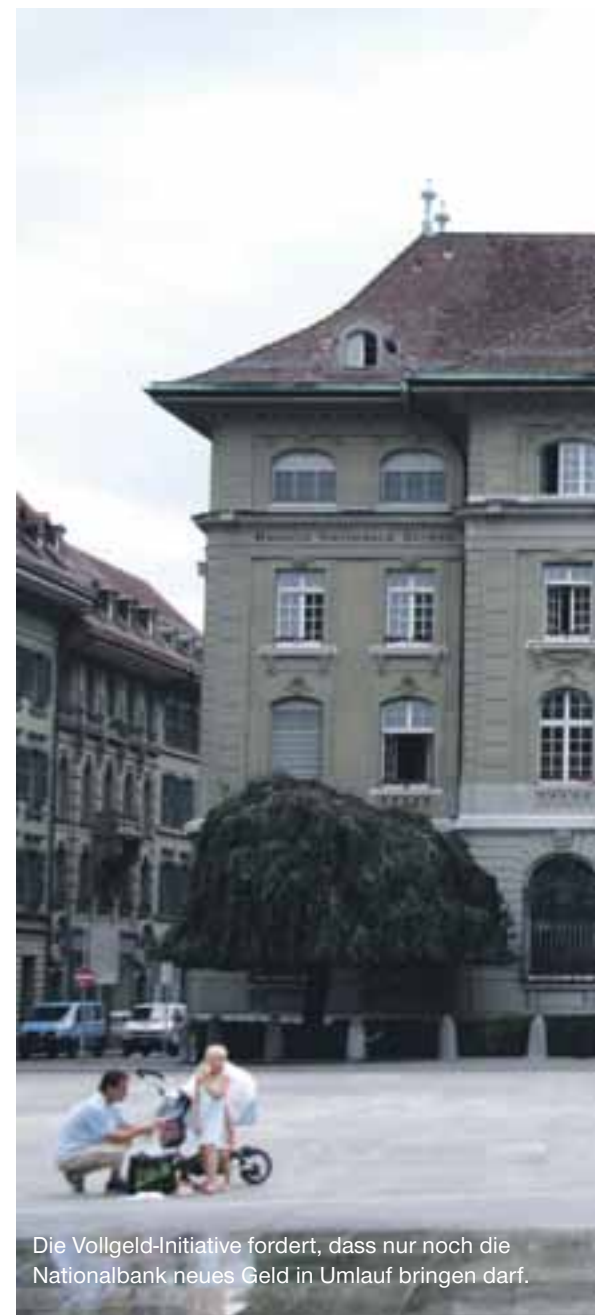
Die Vollgeld-Initiative fordert, dass nur noch die Nationalbank neues Geld in Umlauf bringen darf.

praktiken kennt. Statt einer Belastung von Finanztransaktionen (zum Beispiel mit einer Tobin-Steuer auf Devisenspekulationen) wird der ganze Finanzsektor steuerlich entlastet (Stempelsteuer für alle Obligationen, nicht nur für CoCos) und nur mangelhaft reguliert (Hedgefonds). Und wenn die Banken es für nötig halten, ändert der Bundesrat innert weniger Wochen seine Meinung in rechtsstaatlich wesentlichen Fragen (Auslieferung von Daten über Bankmitarbeiter an die USA). Falls der Staat Kredite braucht, ist er auf die gewinnorientierten Geschäftsbanken angewiesen; seit