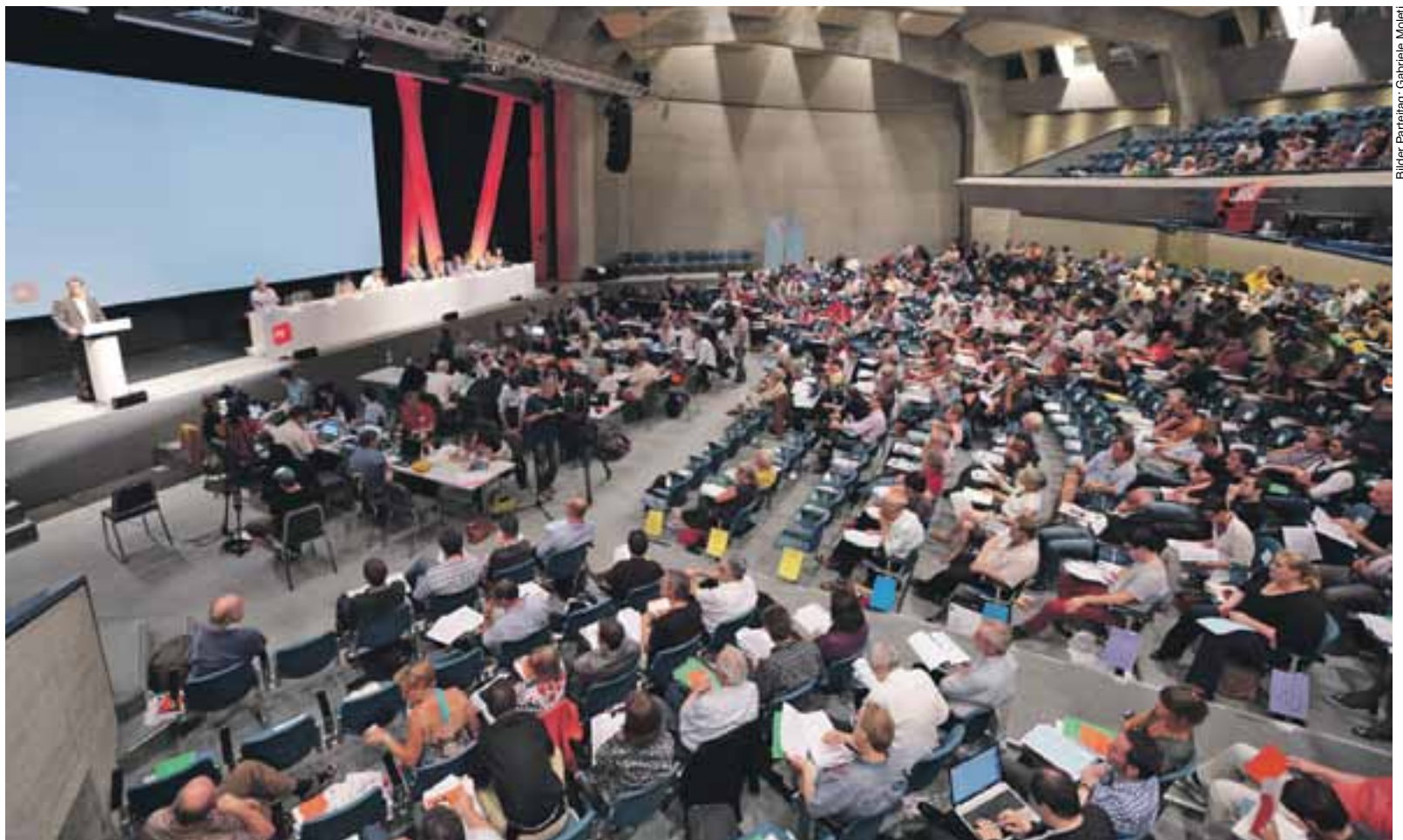
Bilder: Parteitag, Gabriëlle Moletti

einen Schutzhelm tragen müssen. Ebenfalls aus dem Papier gestrichen wurden die Integrationsvereinbarungen. Eine weitere Änderung betrifft das Nothilfe-Regime, das nicht mehr zur Anwendung kommen soll. Zusätzlich aufgenommen wurde dagegen die Forderung, dass in der Schweiz geborene Kinder nach fünf Jahren automatisch das Schweizer Bürgerrecht erhalten sollen.