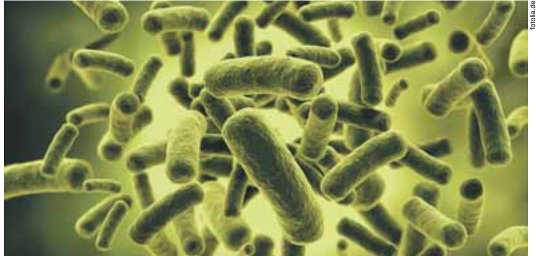
Immer öfter tauchen Bakterien auf, die gegen alle bekannten Medikamente resistent sind.

Ich freue mich auf die Arbeit, die Zusammenarbeit mit allen Interessierten und auf neue Ideen, Visionen und Projekte. Wo immer ich politisiere, die Anliegen der Frauen sind mir stets präsent. Vielen Dank für euer Vertrauen!