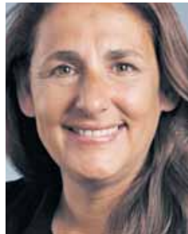
Jacqueline Badran Nationalrätin ZH

Mein Spruch ist jeweils etwa folgender: «Grüezi! Haben Sie die Erbschaftssteuer-Initiative schon unterschrieben? Wir wollen, dass Millionenerbschaften besteuert werden. Dieses Geld fliesst dann in die AHV, damit es allen zugute kommt. Dafür sammeln wir jetzt. Möchten Sie unterschreiben?»