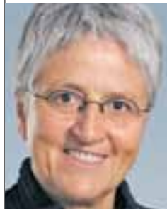
Silva Semadeni ist Nationalrätin aus dem Kanton Graubünden.

Am 11. März 2012 hat das Volk «Basta!» gesagt. Es muss endlich Schluss sein mit dem ausufernden Zweitwohnungsbau, mit Bodenspekulation und Zubetonierung der Landschaft. Innovative Hotels und Pensionen sollen wieder eine Chance erhalten. Sie bringen Arbeitsplätze und Wertschöpfung in die Region. Trotzdem sprachen die Gegner der Zweitwohnungsinitiative am Abstimmungsabend von einem «rabenschwarzen Tag für das Berggebiet».