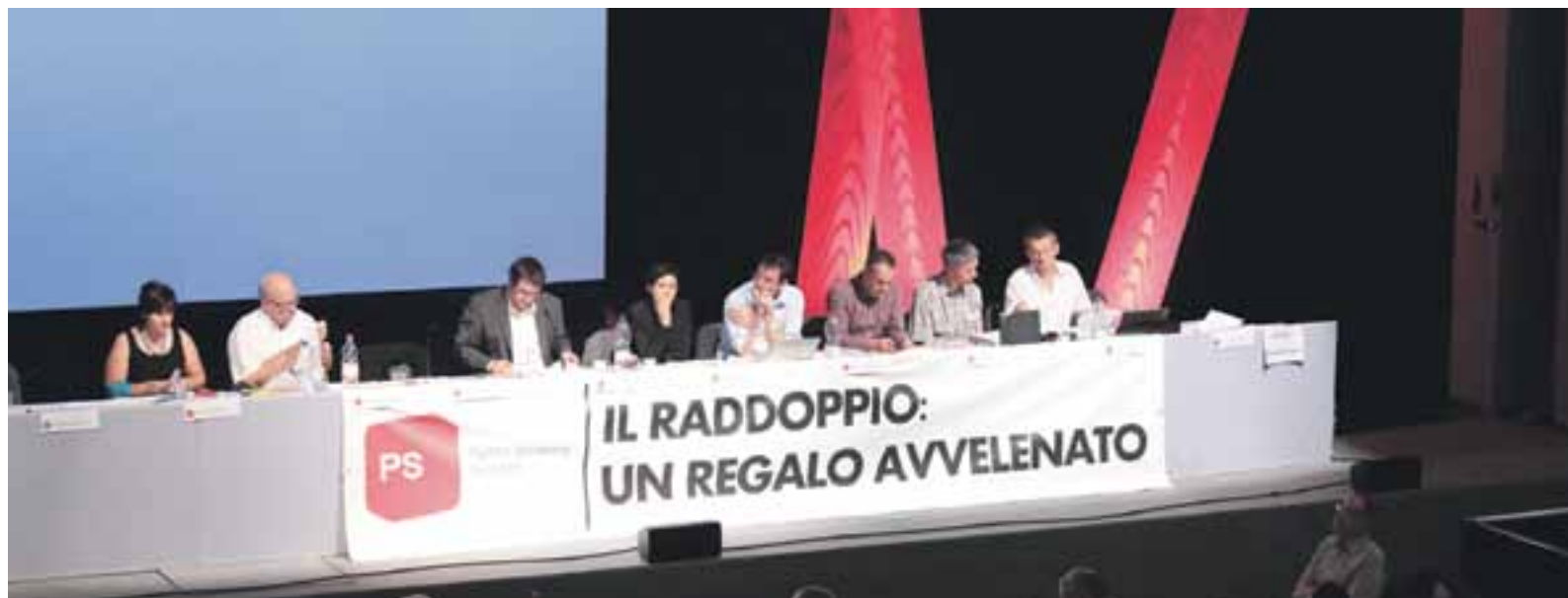
Die SP Schweiz wird sich mit allen Mitteln gegen den «raddoppio» – die Verdoppelung – am Gotthard wehren.