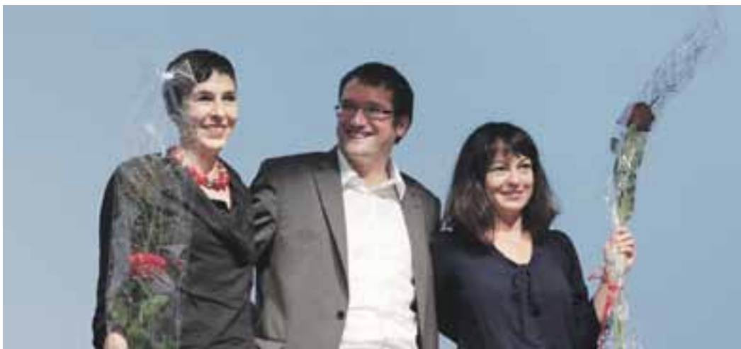
Parteipräsident Christian Levrat gratuliert den beiden neuen Vizepräsidentinnen Barbara Gysi (links) und Géraldine Savary.