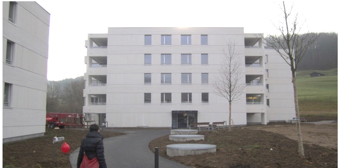
Wohngenossenschaft RIBI Ormalingen

Über 15 Wohngenossenschaften In der Region für Wohnen im Alter