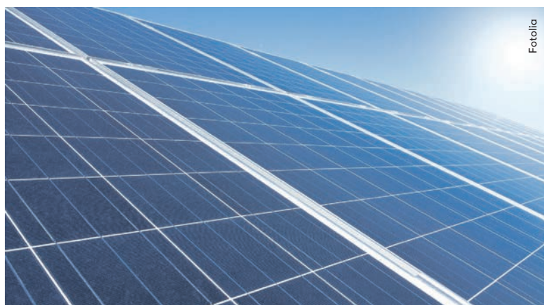
Photovoltaik in Kombination mit Quartierbatterien: Solarstrom aus der Region für die Region.