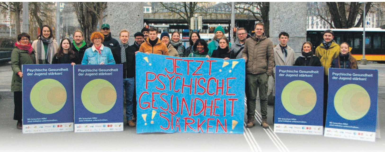
Die JUSO Kanton Luzern hat die Initiative «Psychische Gesundheit der Jugend stärken!» lanciert.

Jetzt zum Unterschriftensammeln anmelden!