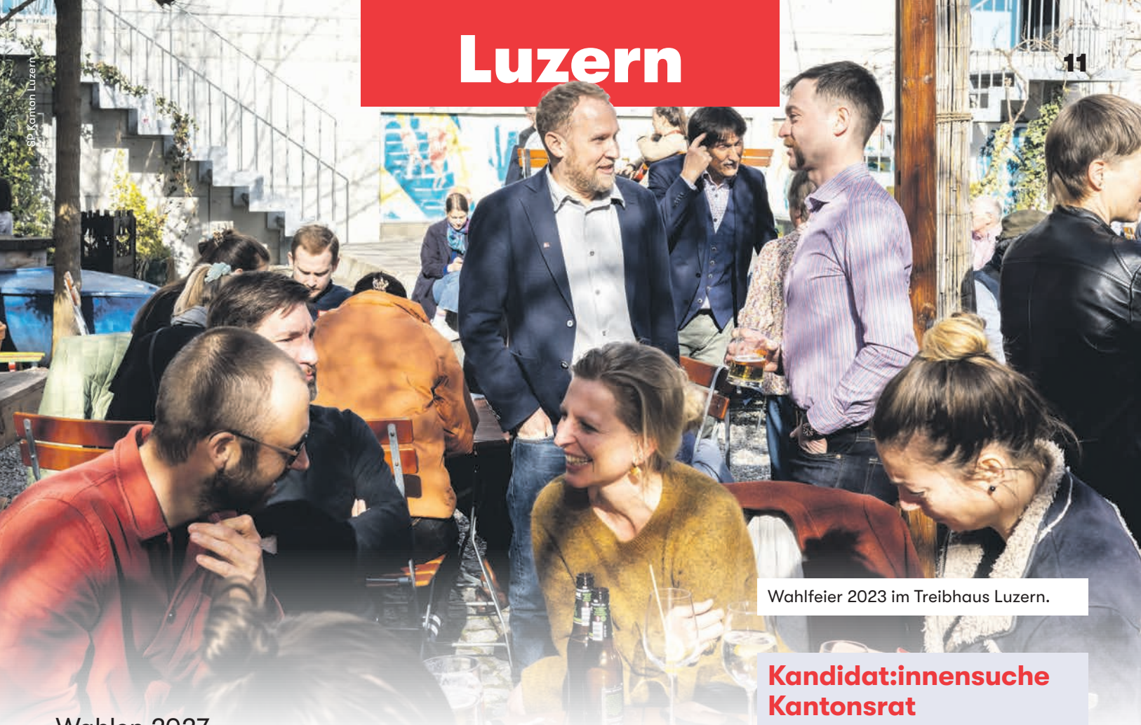
Wahlfeier 2023 im Treibhaus Luzern.