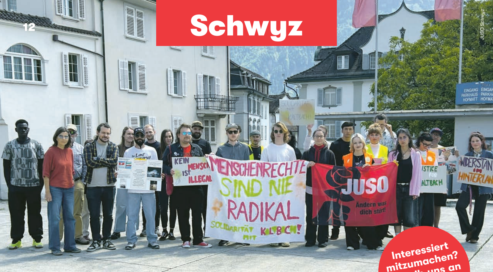
Solidaritätskundgebung der JUSO in Schwyz.