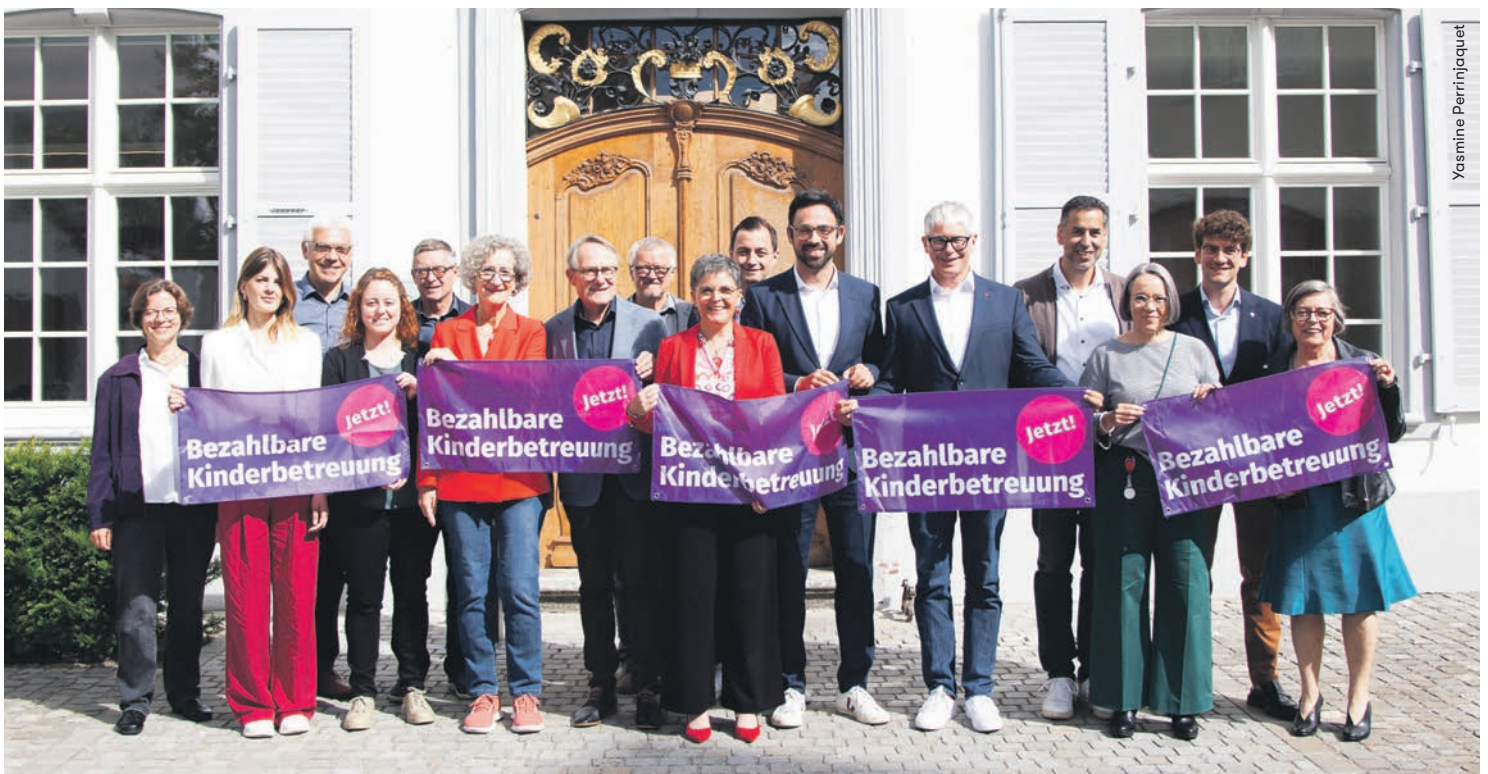
Die SP-Landratsfraktion vor dem Regierungsgebäude, kurz nach dem einstimmigen Beschluss für bezahlbarere Kinderbetreuung.

Auch wenn nicht alle Forderungen der Initiative erfüllt sind, ist dieser Entscheid ein Meilenstein. Das Baselbiet verlässt damit die letzten Ränge, was die Bezahlbarkeit der Kinderbetreuung angeht. Die SP Baselland wird sich auch in Zukunft für die Kaufkraft der breiten Bevölkerung sowie für die Gleichstellung einsetzen.