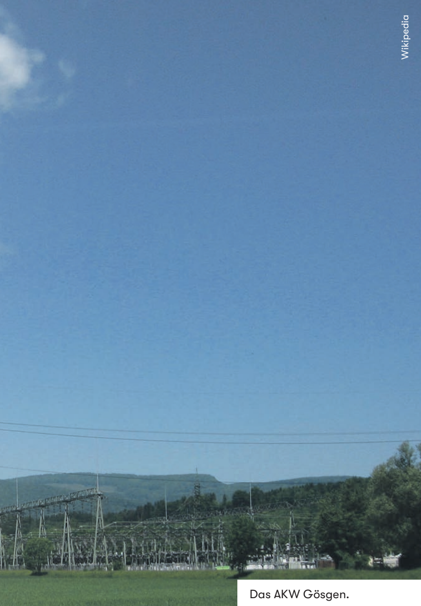
Das AKW Gösgen.

stark die Versorgung durch Ausfälle französischer AKW beeinträchtigt werden kann.