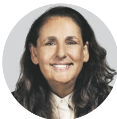
Jacqueline Badran Nationalrätin ZH

Wie hatten wir uns gefreut, als im Juni 2023 in der Stadt Zürich ein Mindestlohn von 23.90 Franken pro Stunde von knapp 70 Prozent der Stimmbevölkerung angenommen wurde. Dasselbe Bild zeigte sich in Winterthur, wo 66 Prozent einen Mindestlohn befürworteten. Es war beruhigend, dass offenbar breite Bevölkerungsschichten die Meinung der SP teilen: Ein Arbeitslohn muss zum Leben reichen! Vor allem aber freuten wir uns für die tausenden Menschen im Niedriglohnsektor, die