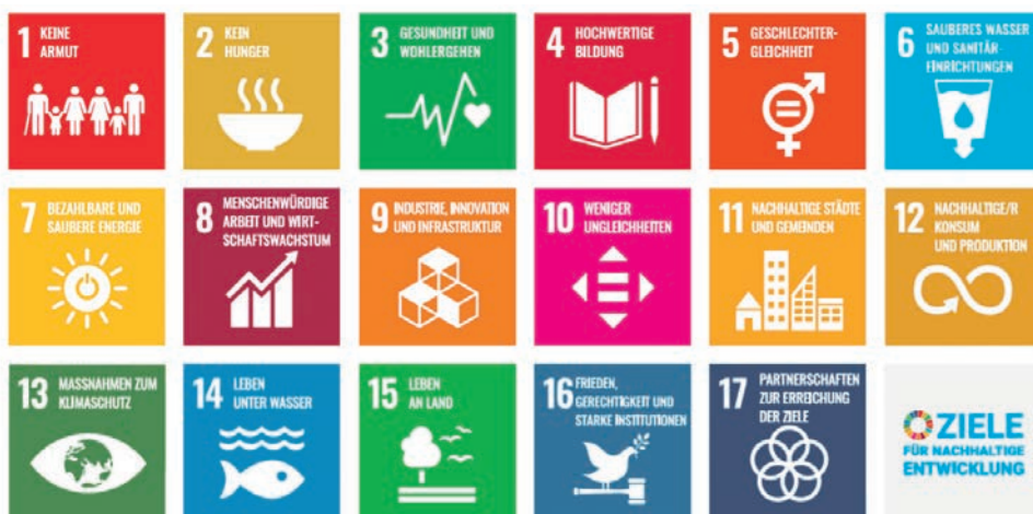
Welches Nachhaltigkeitsziel meint die SVP eigentlich? Nachhaltigkeit hat 17 Ziele. Abschottung ist keines davon.

Wenn andere versuchen, den Begriff Nachhaltigkeit umzudeuten, dürfen wir ihn nicht aufgeben. Wir müssen ihn zurückholen.